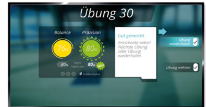
Automatische Ausgabe des Trainingserfolgs