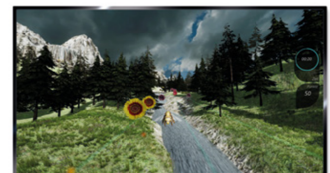
Balancetraining durch Gewichtsverlagerung