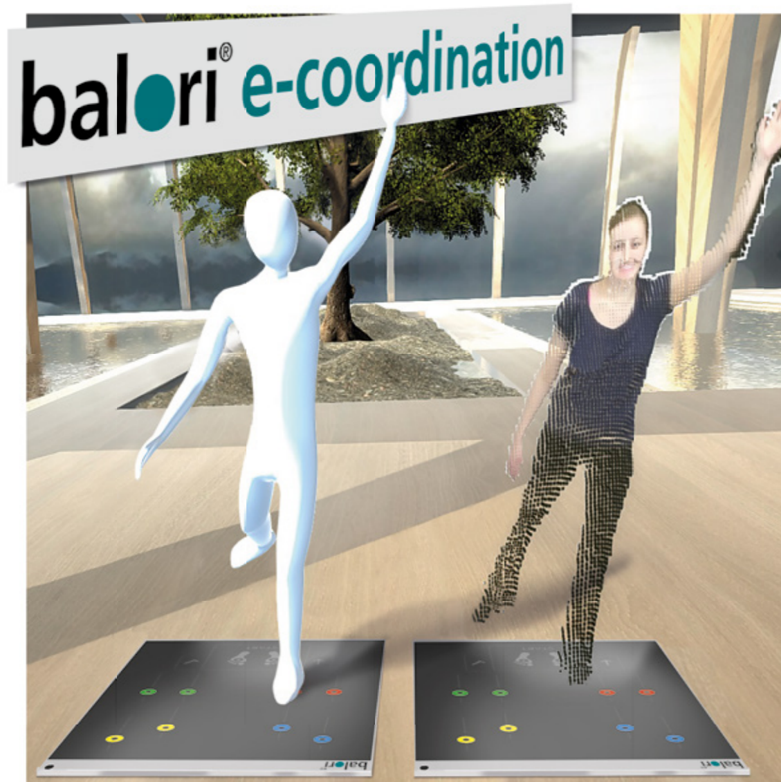
Das System ermöglicht ein Training mit Selbstkontrolle zusammen mit dem Avatar

Gefördert durch die gesetzl. Krankenkassen nach §20 SGB V