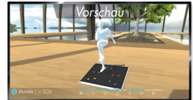
3D-Anleitung mit Avatar im Vorführmodus