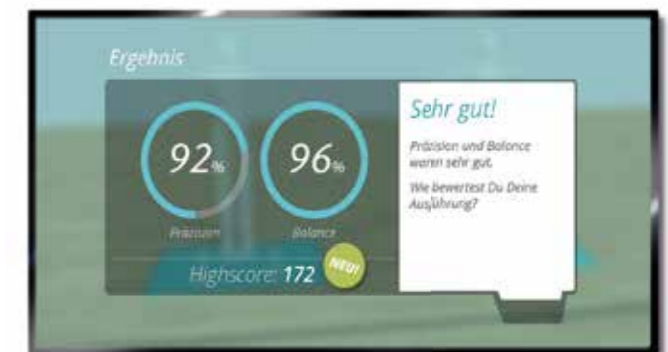
Automatische Ausgabe des Trainingserfolgs