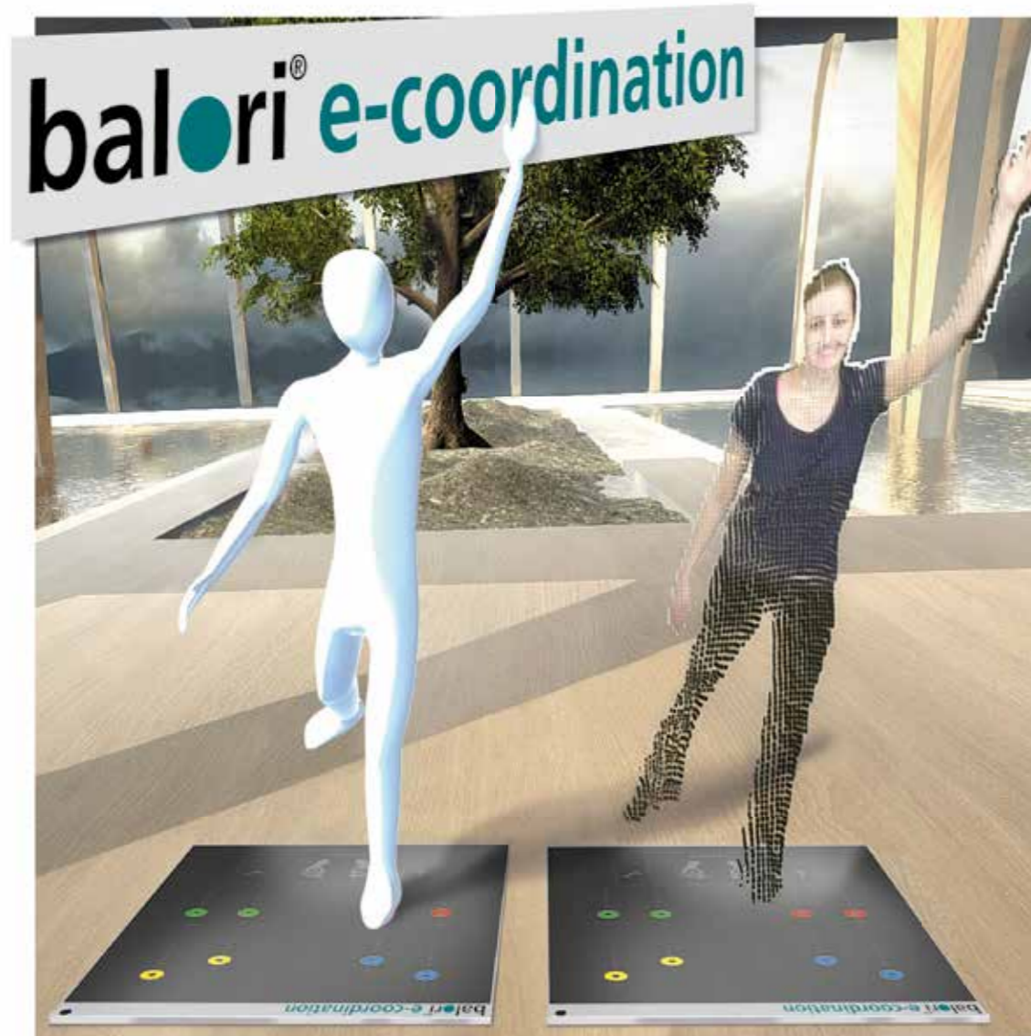
Das System ermöglicht ein Training mit Selbstkontrolle zusammen mit dem Avatar

Gefördert durch die gesetzl. Krankenkassen nach §20 SGB V