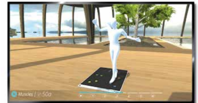
3D-Anleitung mit Avatar im Vorführmodus

Der Trainierende übernimmt die Kontrolle für sein Training und kann die Einheiten jederzeit an den eigenen Leistungsstand anpassen.